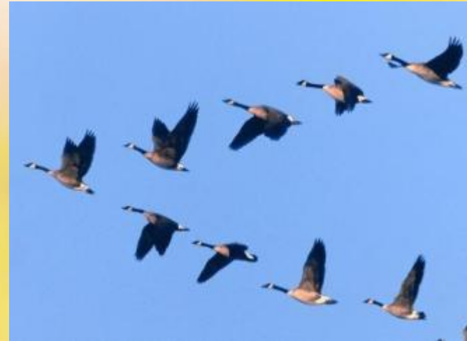
птицы улетают на юг