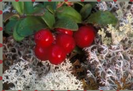
Ягель и брусника