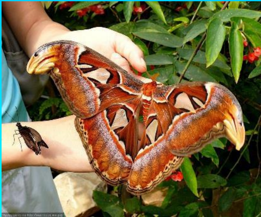
самых больших бабочек (бабочка-агрипина)