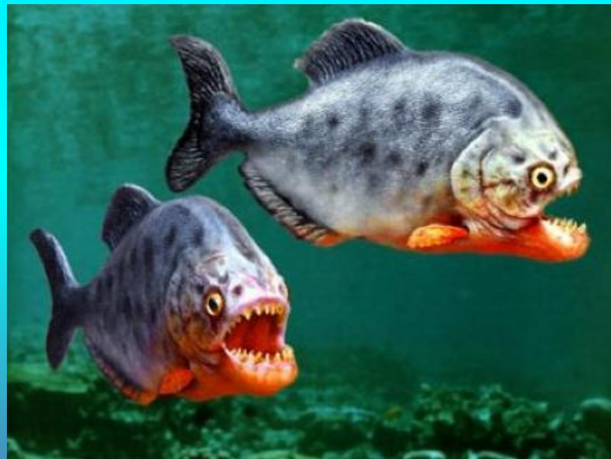
самых опасных рыб (пираньи)