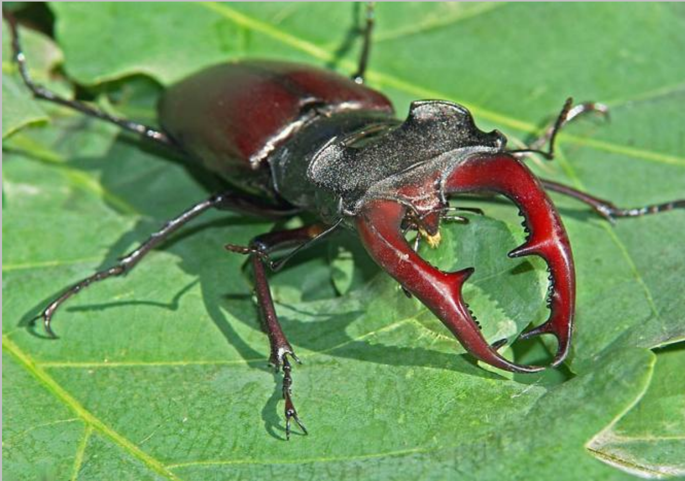
Жук - олень