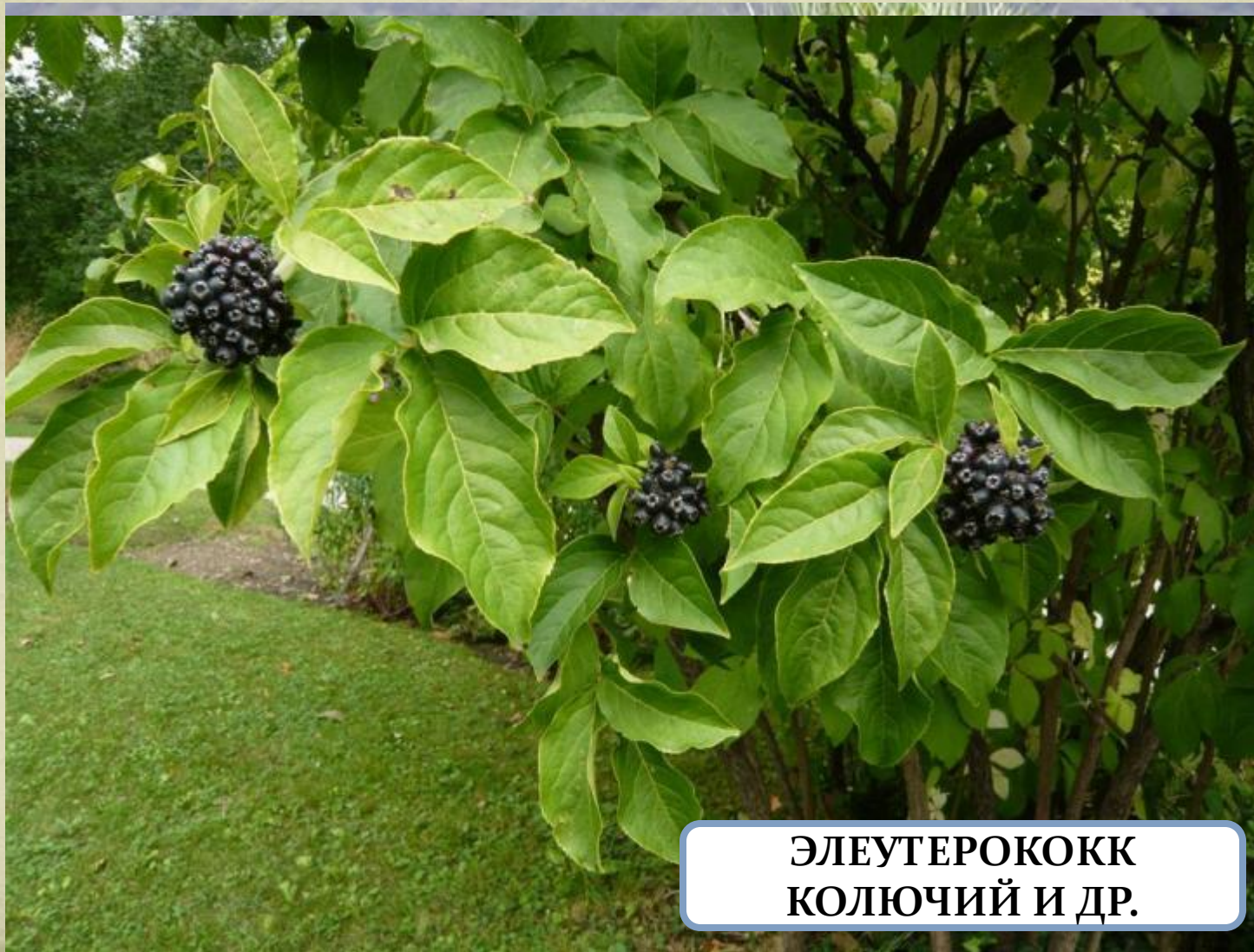
ЭЛЕУТЕРОКОКК КОЛЮЧИЙ И ДР.

Для Хинганского заповедника характерно сочетание луговых, болотных, водных и лесных растений. Леса сложены в основном из: