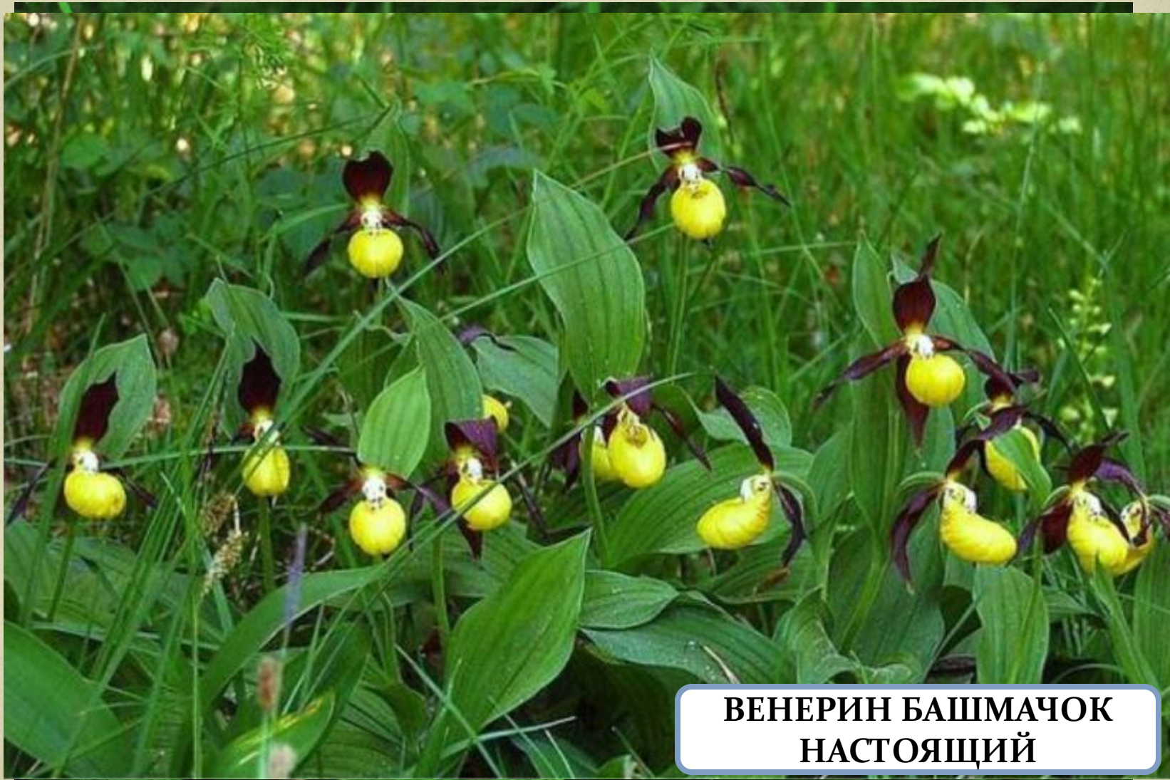
ВЕНЕРИН БАШМАЧОК НАСТОЯЩИЙ

Из редких видов растений, включенных в «Красную книгу России», в заповеднике встречаются :