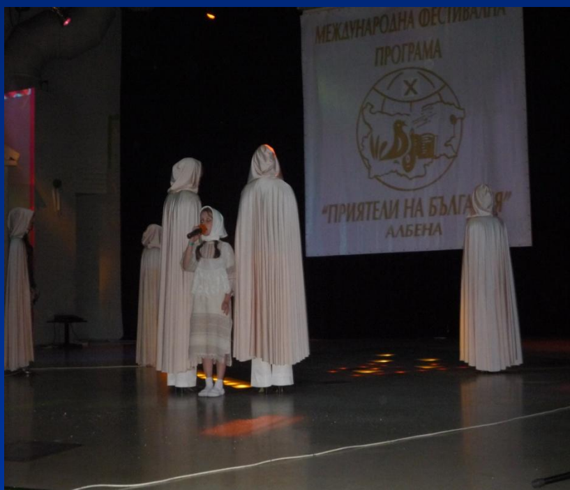
Фото 3 (выступление (я – самая маленькая с микрофоном)