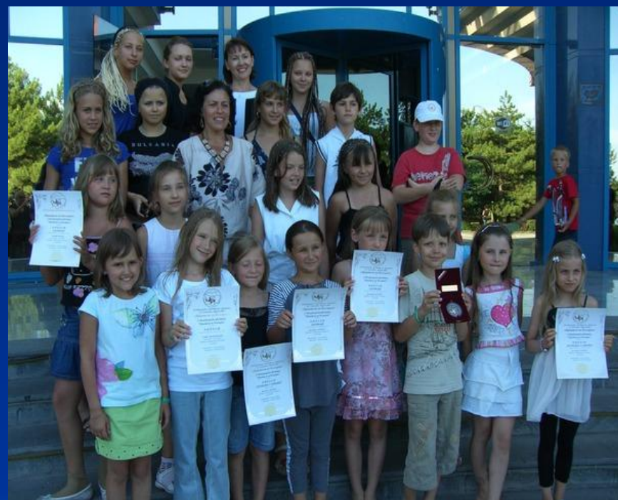
фото 4 (я в первом ряду вторая справа)