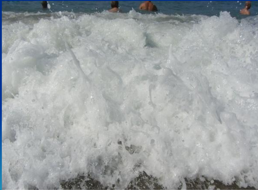
(фото 8 «Побережье Алании»)