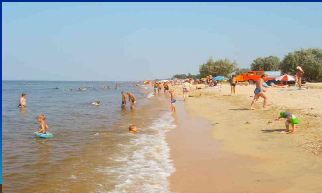
(фото 5 Побережье)