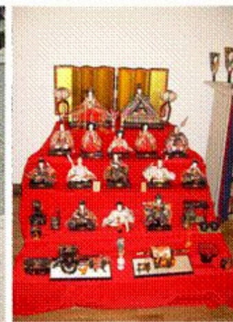
3марта - День девочек