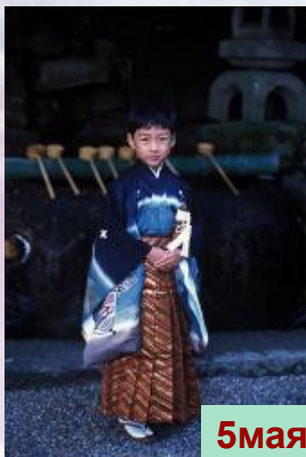
5мая - День мальчиков