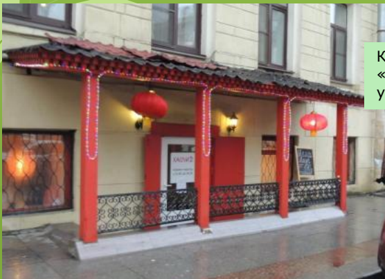
Китайский ресторан «Хаочи» ул. Фурштатская, 12А

Посмотрите, что это висит около входа? Почему вы подумали, что это фонарики? Какие они? Где мы их видели?