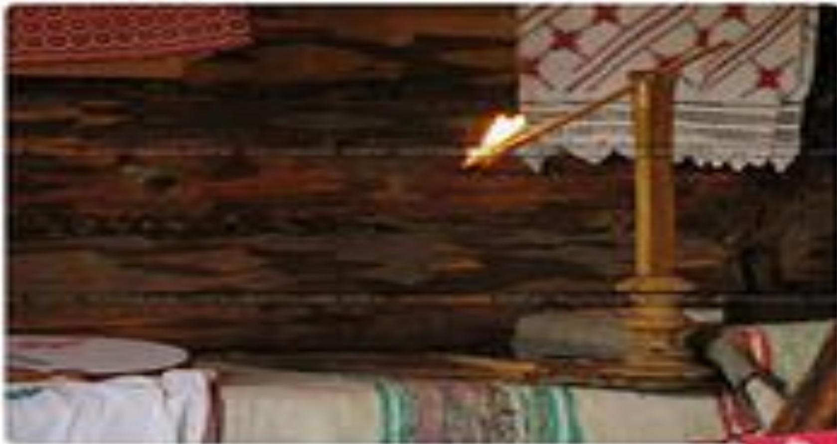
Светильник Лучина

Лучина это обыкновенная деревянная щепка, заостренная на конце. Один конец лучины зажигали, а другой вставляли в специальную подставку, светец .