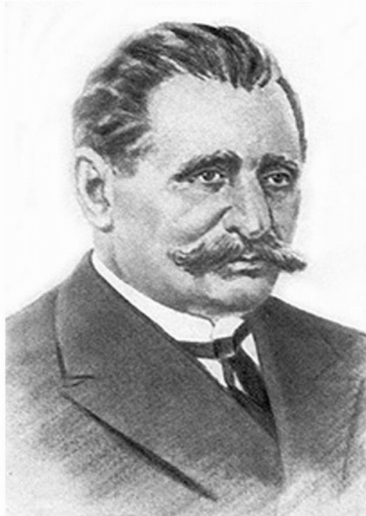
А.Н.Ладыгин – изобретатель электрической лампочки.

Она горела так ярко и была такой удобной и безопасной, что очень скоро люди перестали пользоваться и свечками, и керосиновыми лампами. Электрическая лампочка и сейчас в темные вечера и ночи освещает наши дома и квартиры.