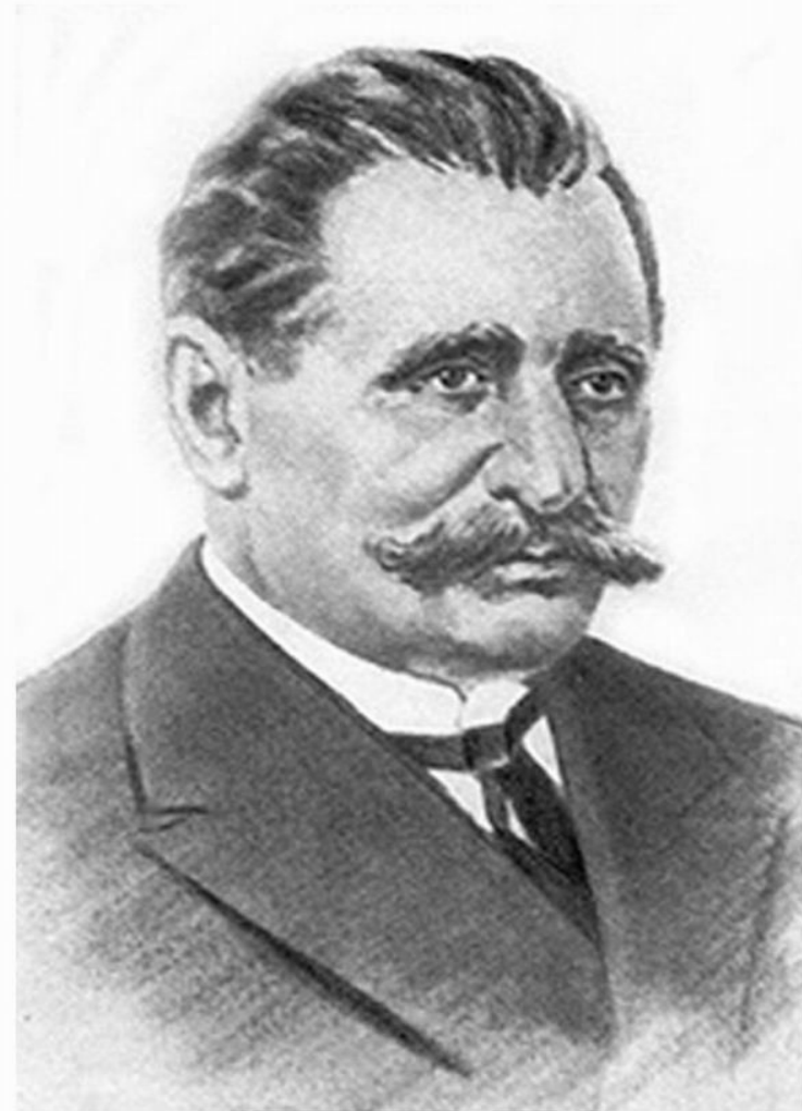
А.Н.Ладыгин – изобретатель электрической лампочки.

Она горела так ярко и была такой удобной и безопасной, что очень скоро люди перестали пользоваться и свечками, и керосиновыми лампами. Электрическая лампочка и сейчас в темные вечера и ночи освещает наши дома и квартиры.