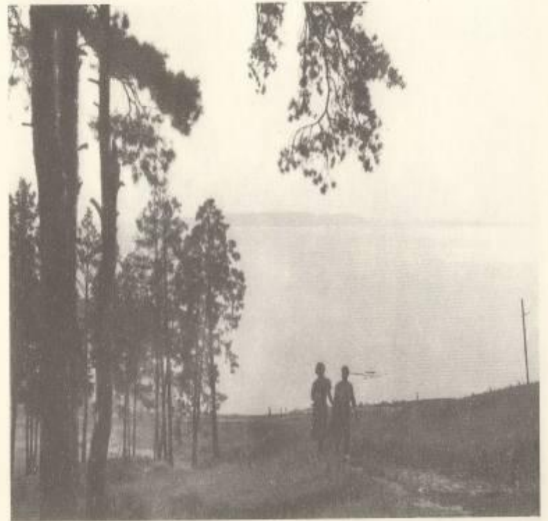
Место, где был г. Ставрополь. 60-е годы XXв.