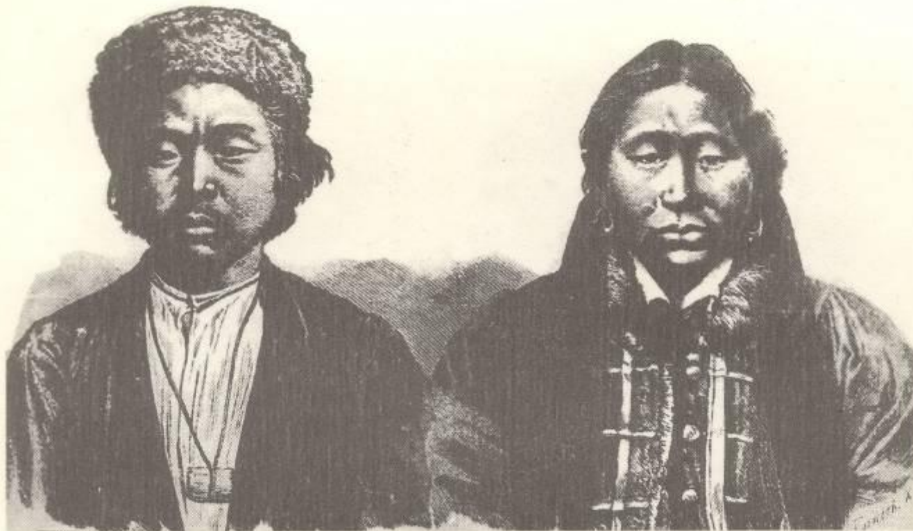
Калмыки. XVII в.