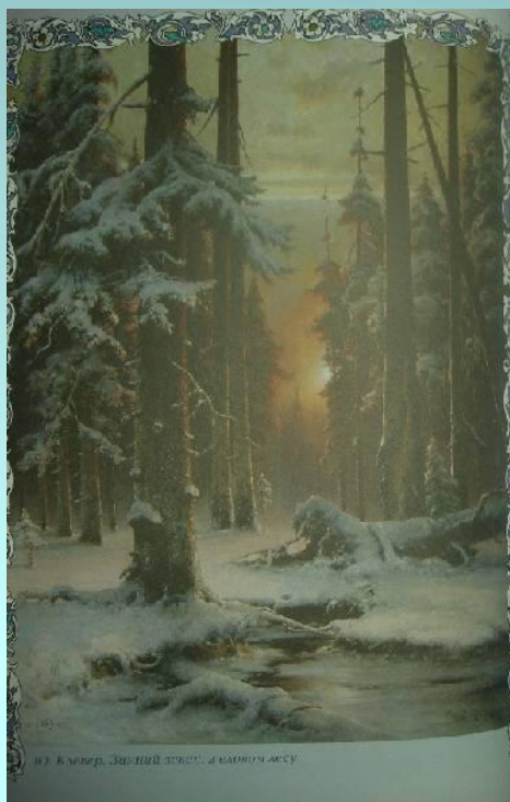
12. В лесу, выпав снегу, а еловым лесу

Средь белых елок Соблазнам, ах стоит — И немешковит, блуждая, Не случайно о плывом, Чуждым, аснова он блещет.