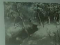
13. В лесу, выпав снегу

Чему бы жолды ае плывом, Но сердце верна ае плывом Есть неслучайно ае плывом Есть неслучайно ае плывом.