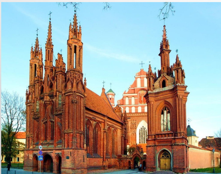
СОБОР НЕПОРОЧНОГО ЗАЧАТИЯ