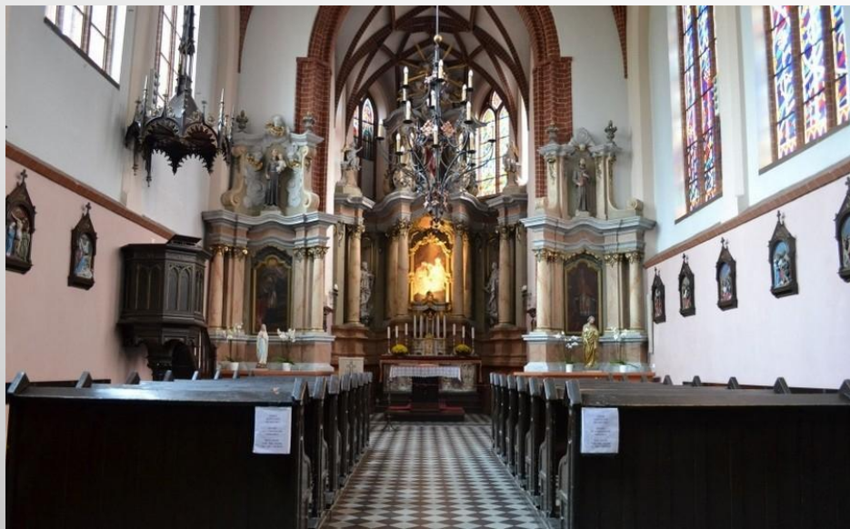
КОСТЁЛ СВЯТОЙ АННЫ