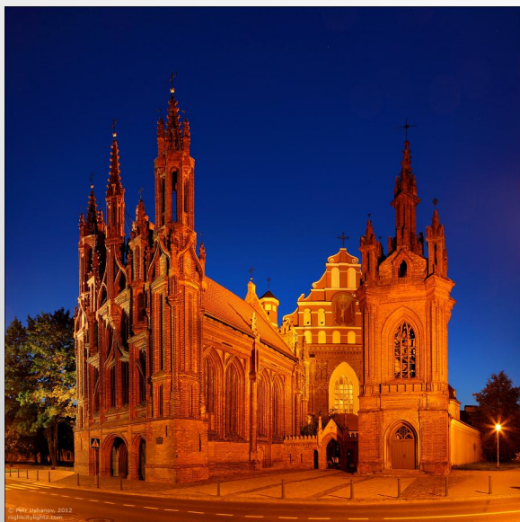
СОБОР НЕПОРОЧНОГО ЗАЧАТИЯ