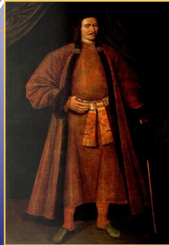
Нарышкин Л.К. - дядя Петра I

В 1689 году Софья была отстранена от престола, и власть перешла к Петру I, а управление страной доверено его матери и дяде Л. К. Нарышкину.