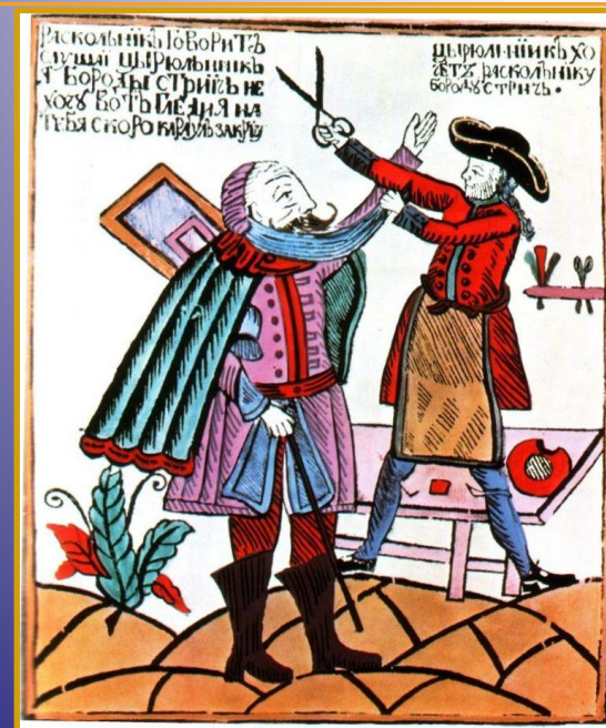
Насильственное бритьё бород.

В образовании также им были проведены ряд реформ, направленные на массовое просвещение: открыто множество школ для детей и первая в России гимназия(1705).