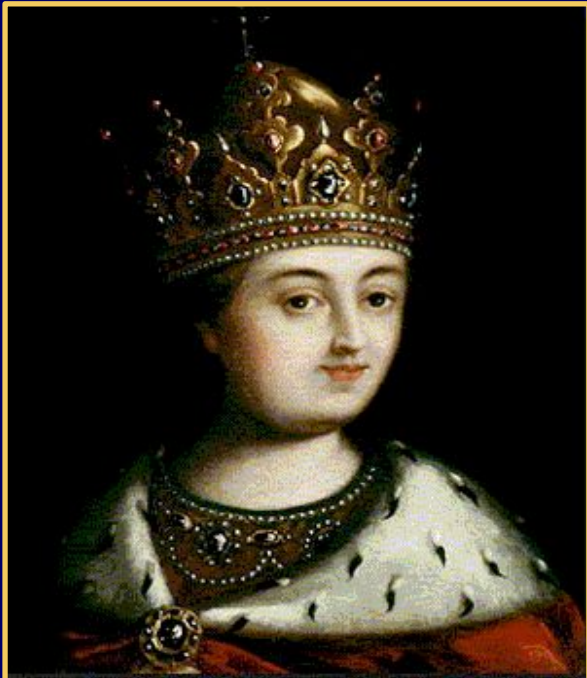
Софья Алексеевна - царевна, старшая сестра Петра I

В 1682 году, после смерти старшего сводного брата Фёдора Алексеевича, 10-летний Петр и его брат Иван были провозглашены царями. Оба брата, один из-за возраста, другой из-за нездоровья, не могли участвовать в борьбе за власть. И фактически управление взяла на себя их старшая сестра — царевна Софья Алексеевна.