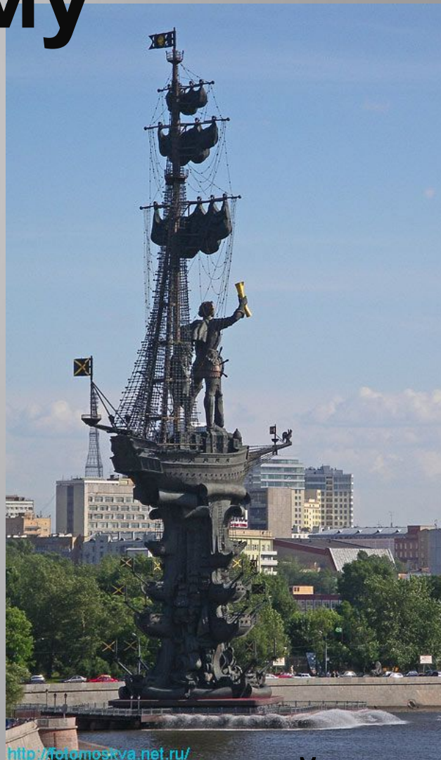
300 -летию российского флота