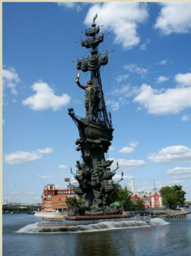
Памятник Петру I в Москве (1997)