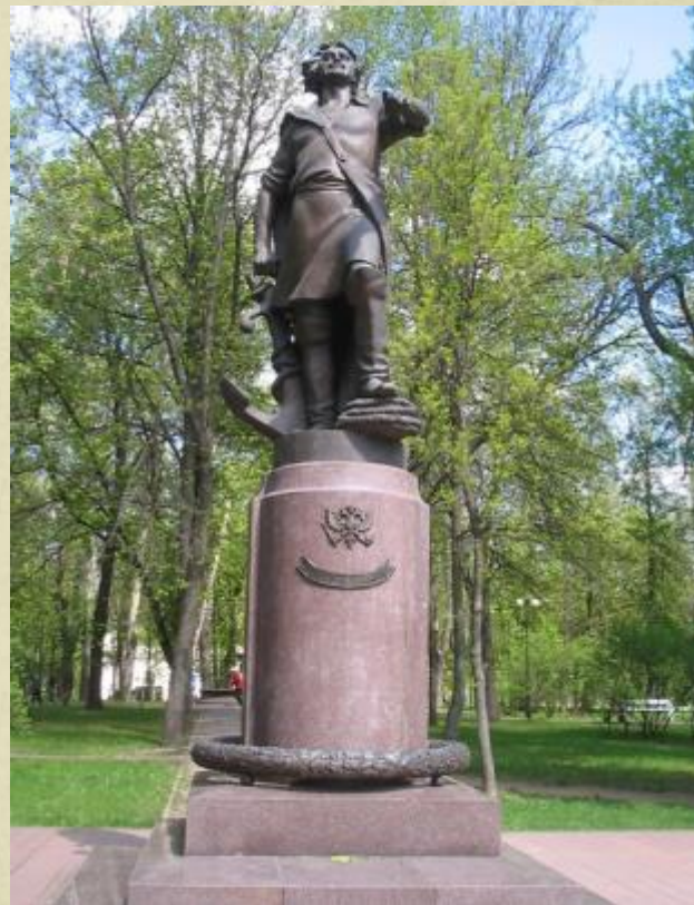
Памятник Петру I в Измайлово (1998)