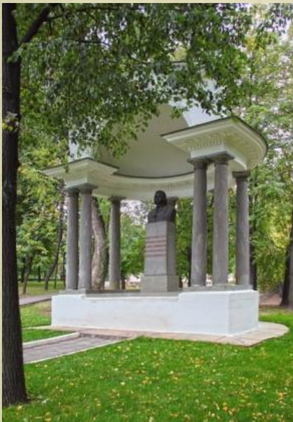
Памятник-бюст Петру I в Лефортовском парке