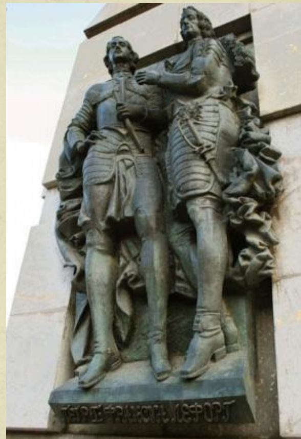
Памятник Петру I и Францу Лефорту в Лефортово