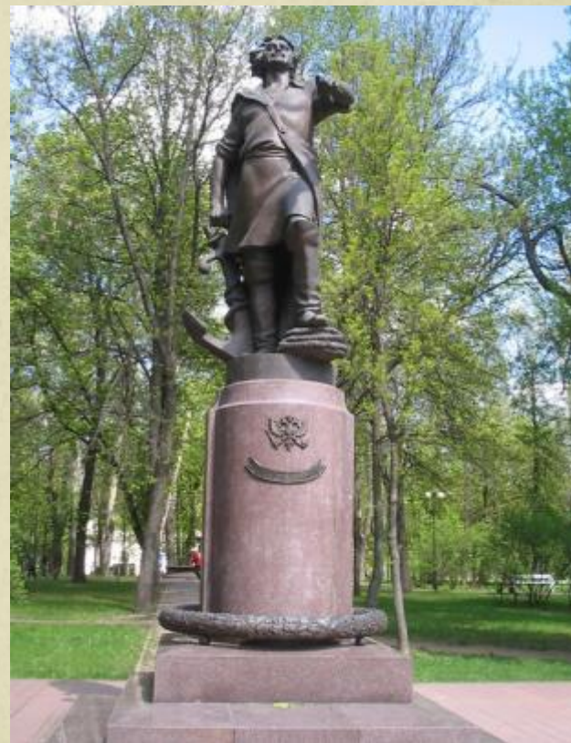
Памятник Петру I в Измайлово (1998)