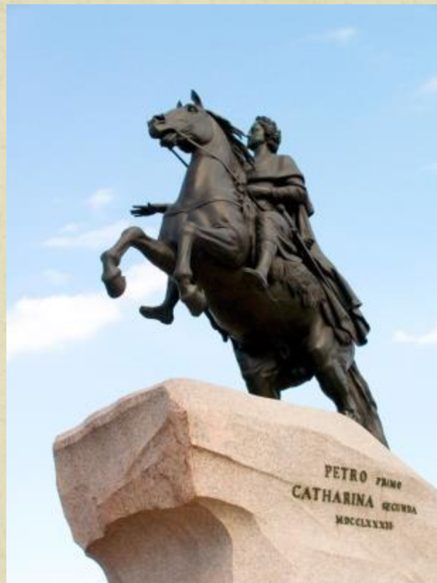
«Медный всадник» в Петербурге (1782)