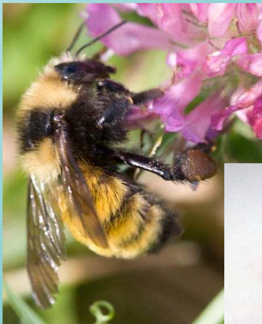
северный ЗОЛОТОЙ ШМЕЛЬ

Летом в тундре много комаров, мошек, северных шмелей.