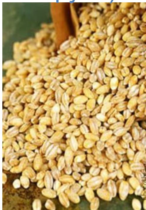
ячмень (перловая крупа)