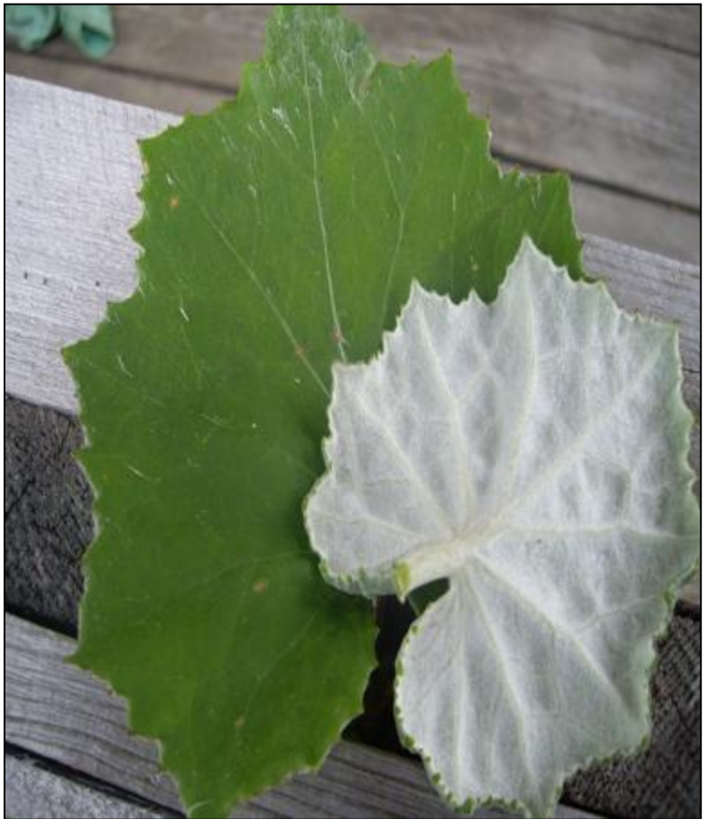
мать – и – мачеха