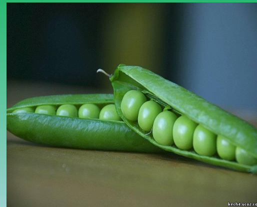
Плод гороха (горох)