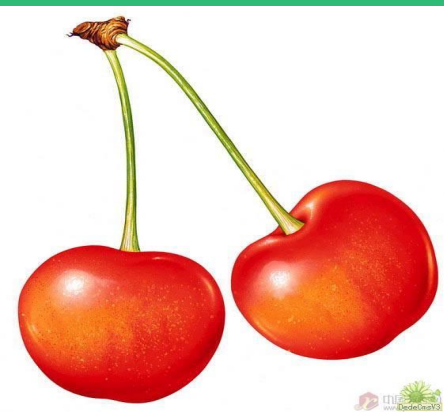
Плод вишни (костянка)