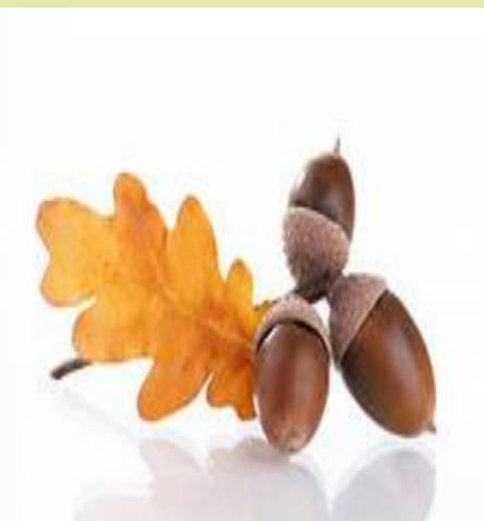
плод дуба (желудь)