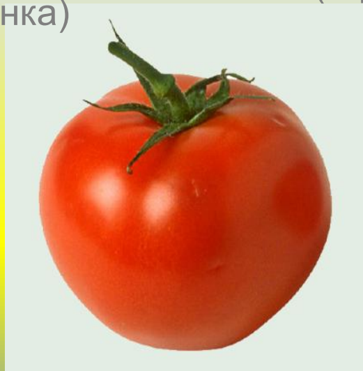
плод томата (ягода)