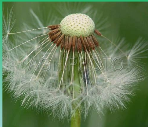
Плод одуванчика (семянка)