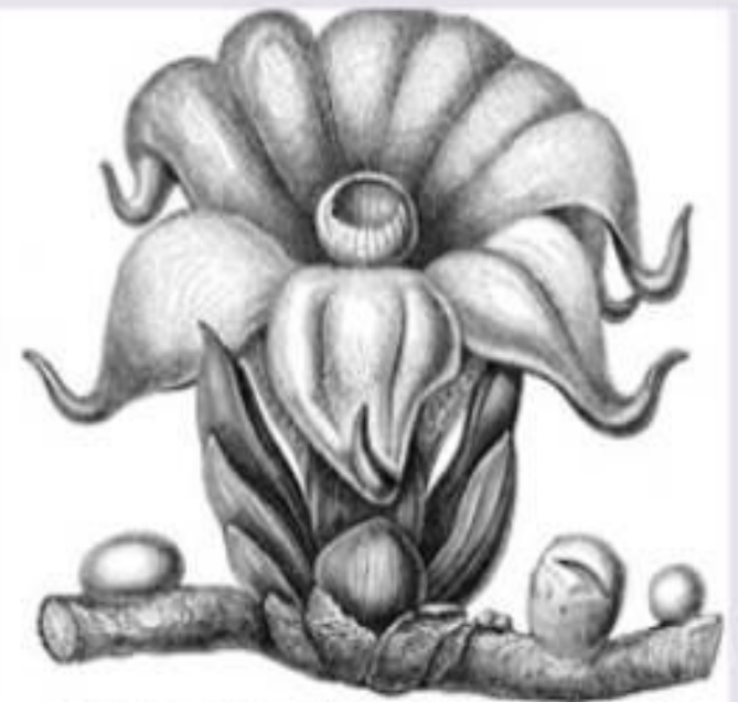
Phloxiparis bellidifolia (Nepenthes) Sporangium of the Stamens. (p. 5. 18 and 19)