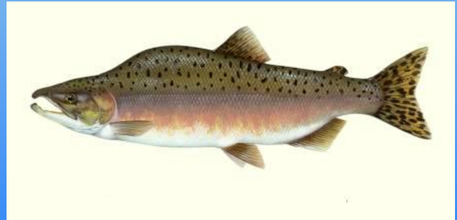
самец в брачный период