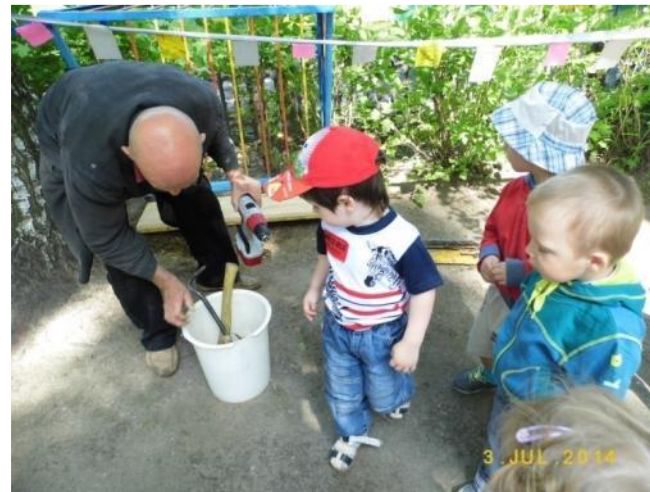
Ознакомление с трудом плотника