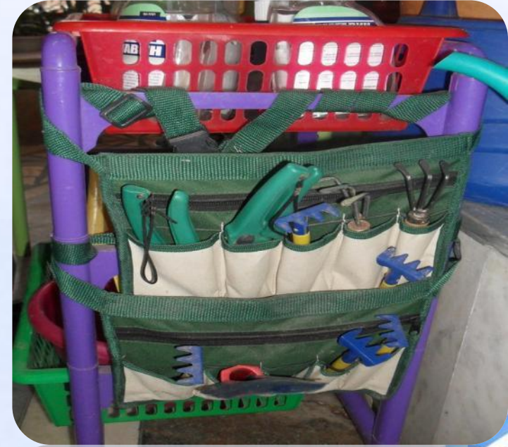
Инструменты для ухода за растениями