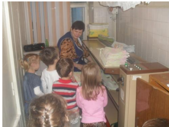
Ознакомление с трудом практики