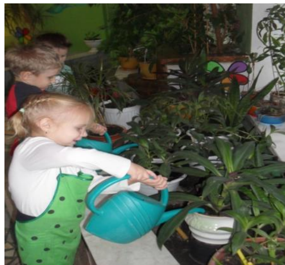
Полив растений в зимнем саду