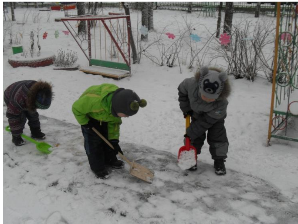
Расчистка дорожек от снега на участке