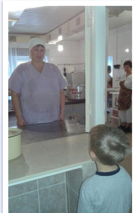
Ознакомление с трудом повара