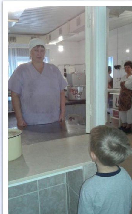
Ознакомление с трудом повара