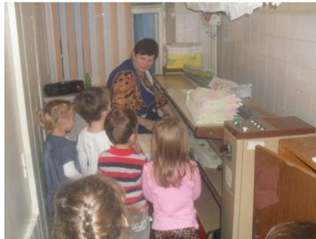
Ознакомление с трудом практики