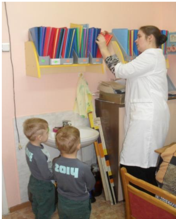
Ознакомление с трудом мед.сестры