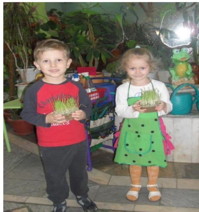
Выращивание зелени для корма птицам