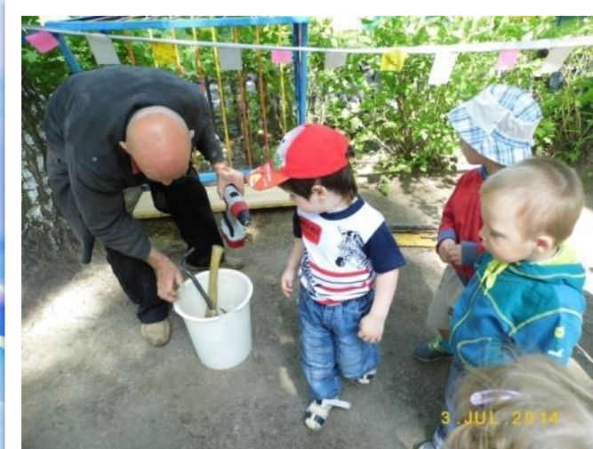
Ознакомление с трудом плотника