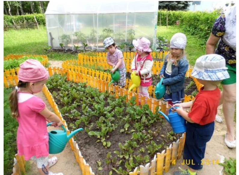
Труд на огороде