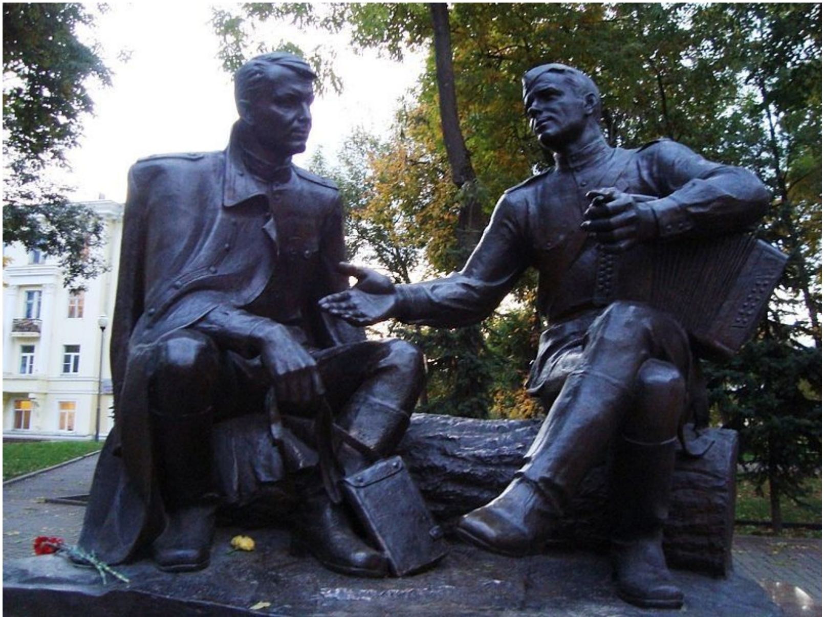
Александр Твардовский и Василий Тёркин. Памятник в Смоленске