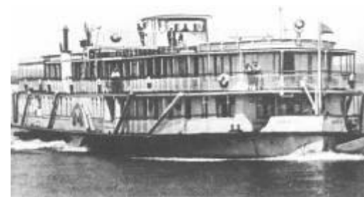
П/х СОБИНОВ Пост. 1932, Горький, з-д Кр. Сормово М - 365 лс, ск. - 14 км/ч, пас. - 91-450 ч., гр. - 250 т Б. "Каганович"