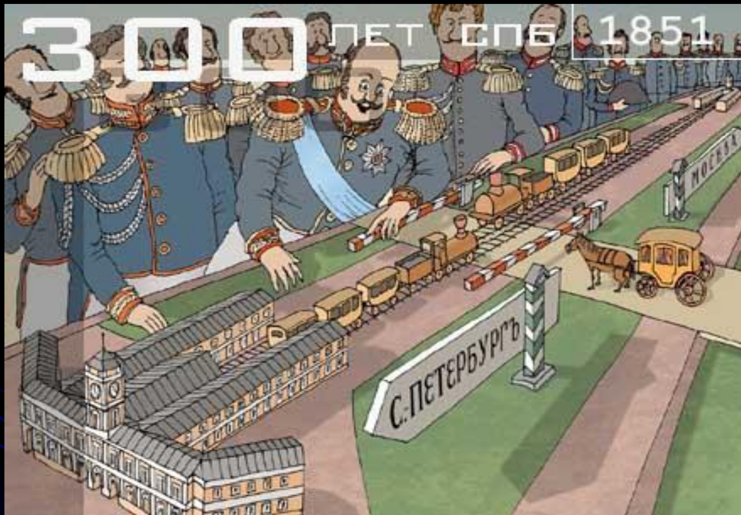
Дорога от Санкт-Петербурга до Москвы