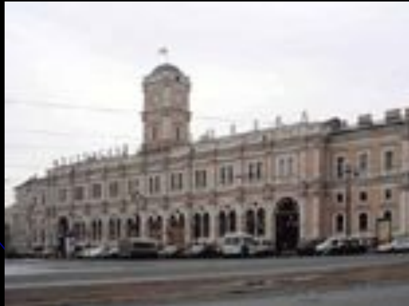
Московский «Бывший Николаевский» вокзал Санкт - Петербурга.