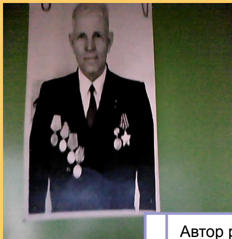
Автор работы ученица 3 «б» класса: Анфимова Снежана.