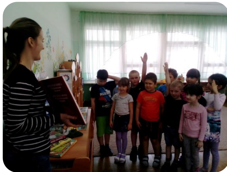
Беседа «Дикие животные родного края»