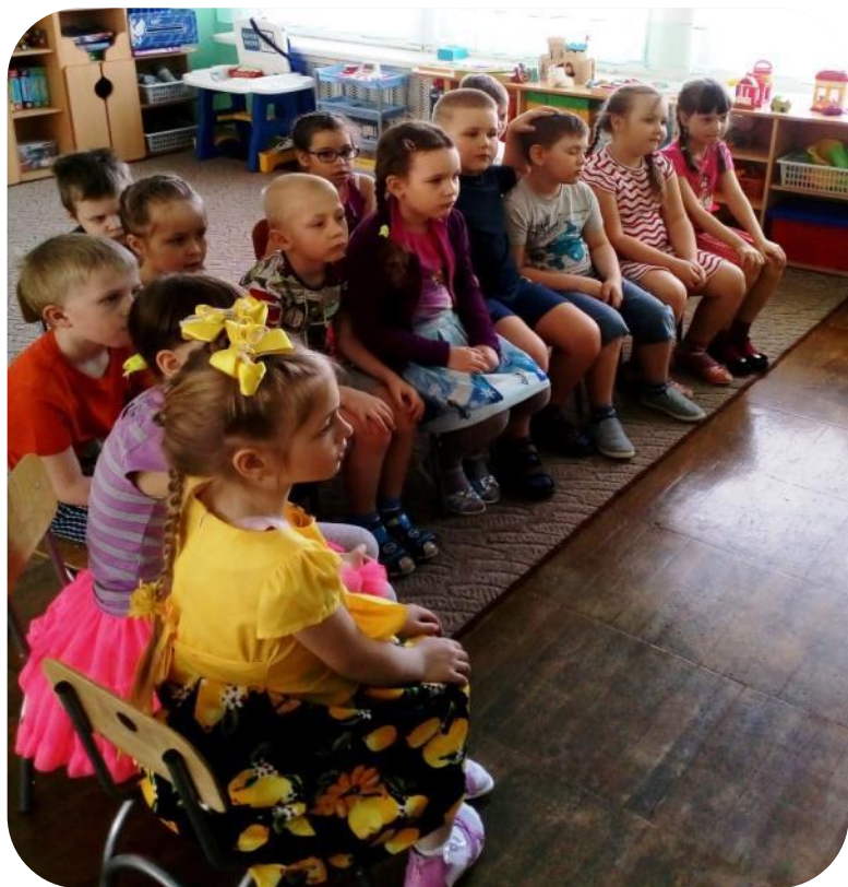
Презентация «Главная книга природы»