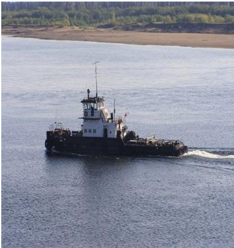
Буксир (в р-не г. Печора)

ПРИМЕРНО В 130 КМ ОТ УСТЬЯ ПЕЧОРА ДЕЛИТСЯ НА ДВА РУКАВА – ВОСТОЧНЫЙ (БОЛЬШАЯ ПЕЧОРА) И ЗАПАДНЫЙ (МАЛАЯ ПЕЧОРА). НИЖЕ, В РАЙОНЕ НАРЬЯН-МАРА, РЕКА ОБРАЗУЕТ ДЕЛЬТУ ШИРИНОЙ ОКОЛО 45 КМ И ВПАДАЕТ В ПЕЧОРСКУЮ ГУБУ ПЕЧОРСКОГО МОРЯ.