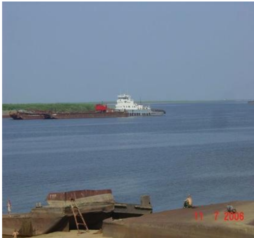
Печора возле Нарьян-Мара