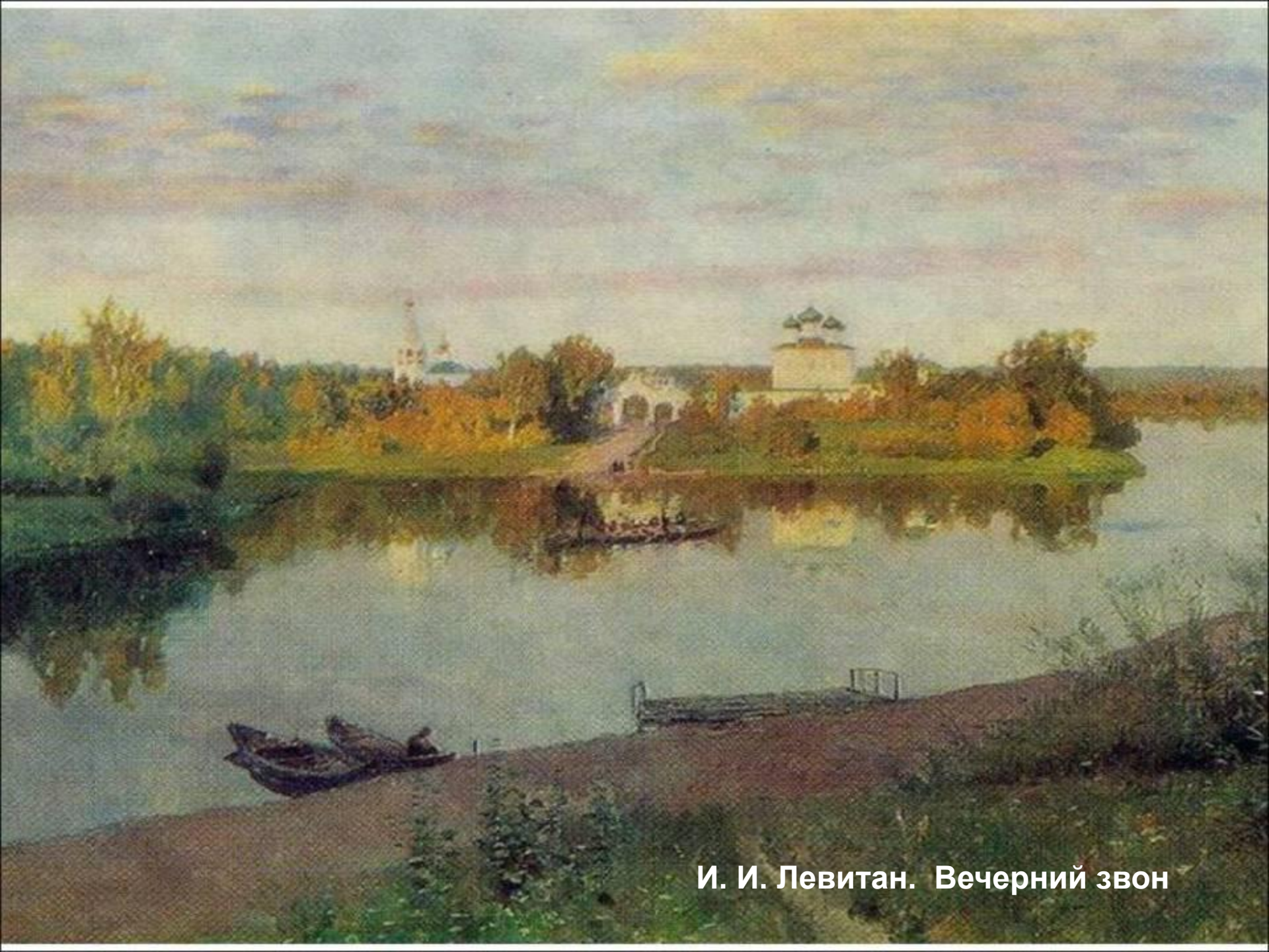
И. И. Левитан. Вечерний звон