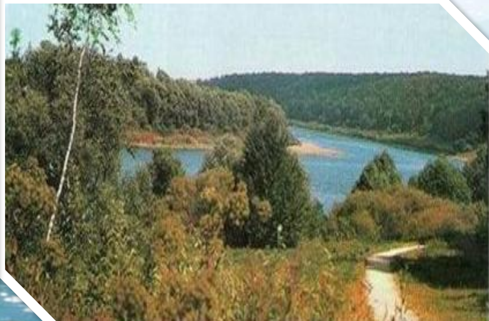
Река Ока – левый приток Волги