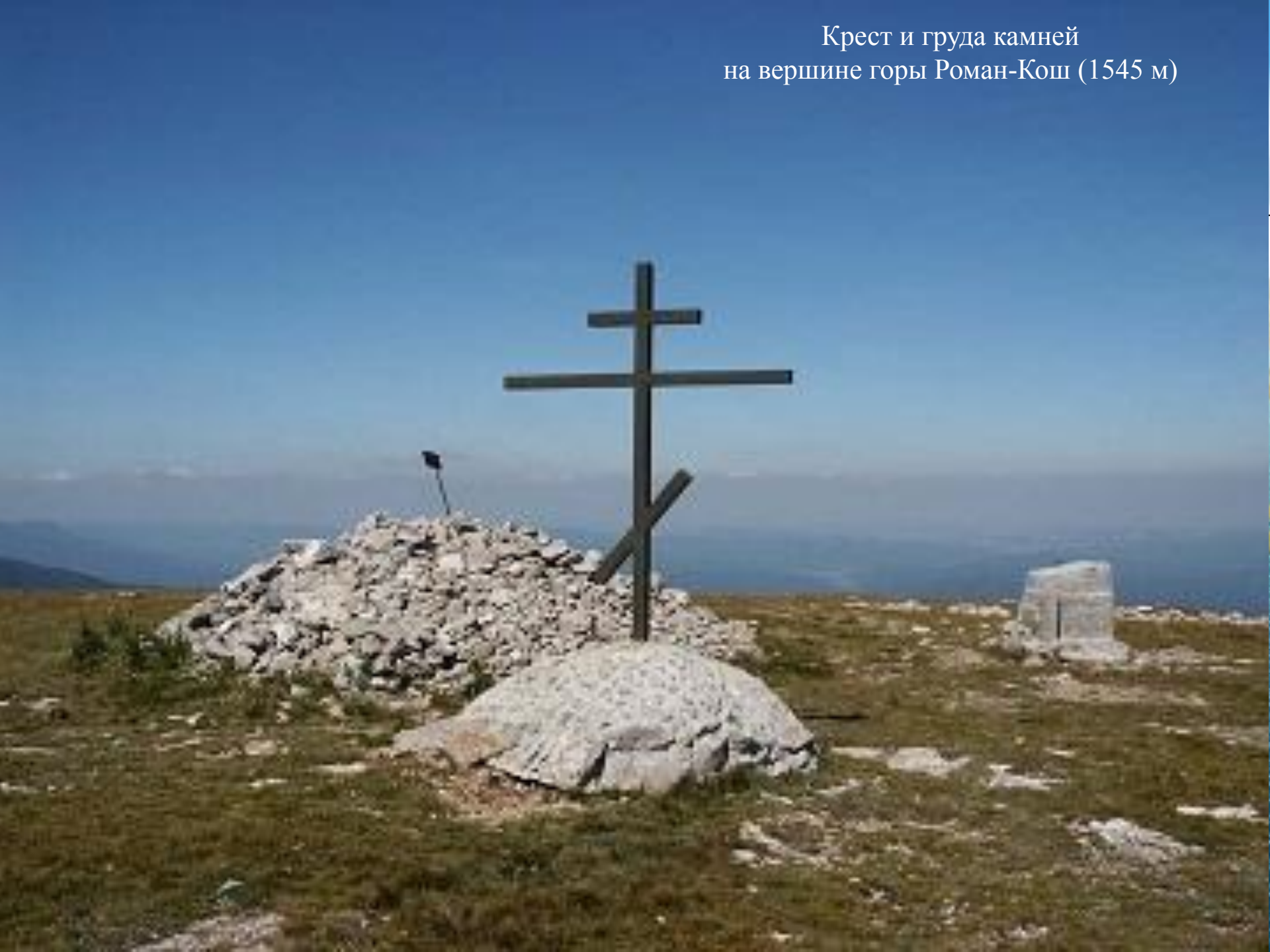
Крест и груда камней на вершине горы Роман-Кош (1545 м)