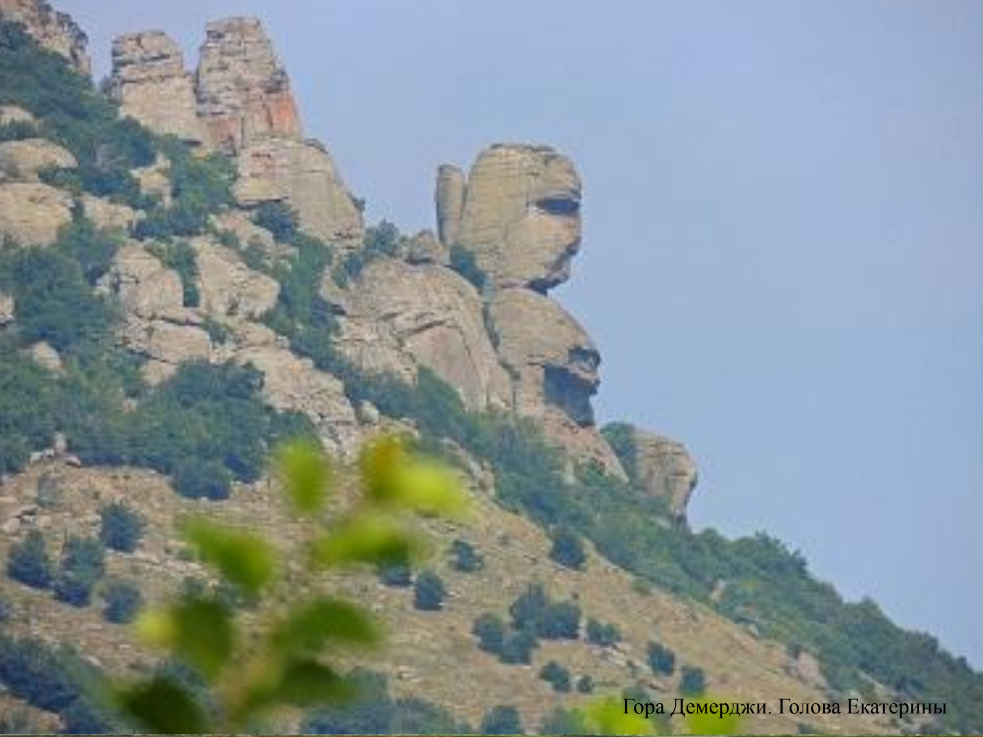
Гора Демерджи. Голова Екатерины