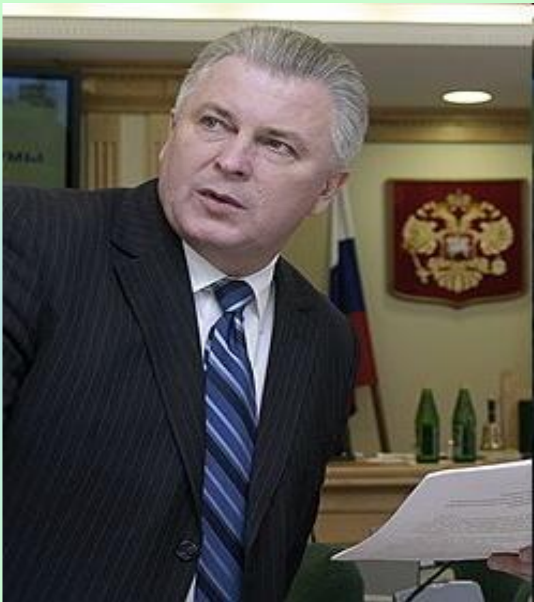
Президент Республики Бурятия- Ноговицын В.В.