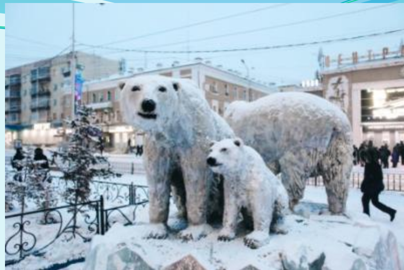
Памятник белым медведям