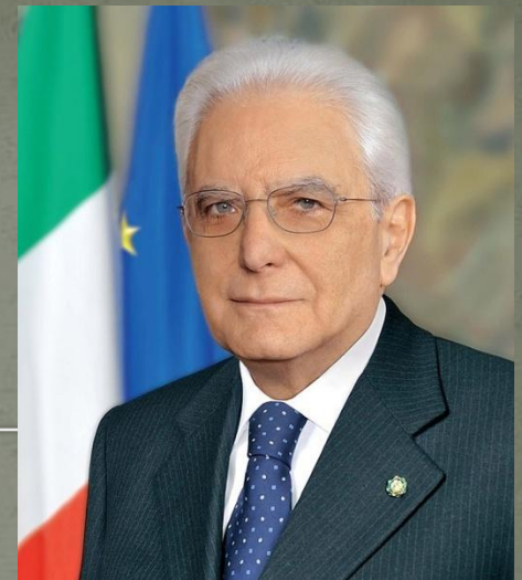
Президент Италии Серджо Маттарелла