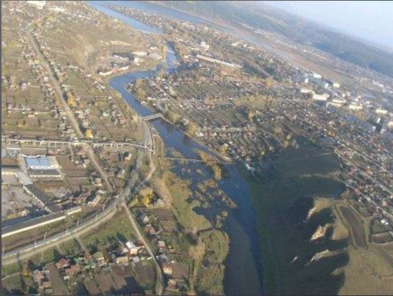
Вид города сверху (река Юрюзань, Лука, Маяк)