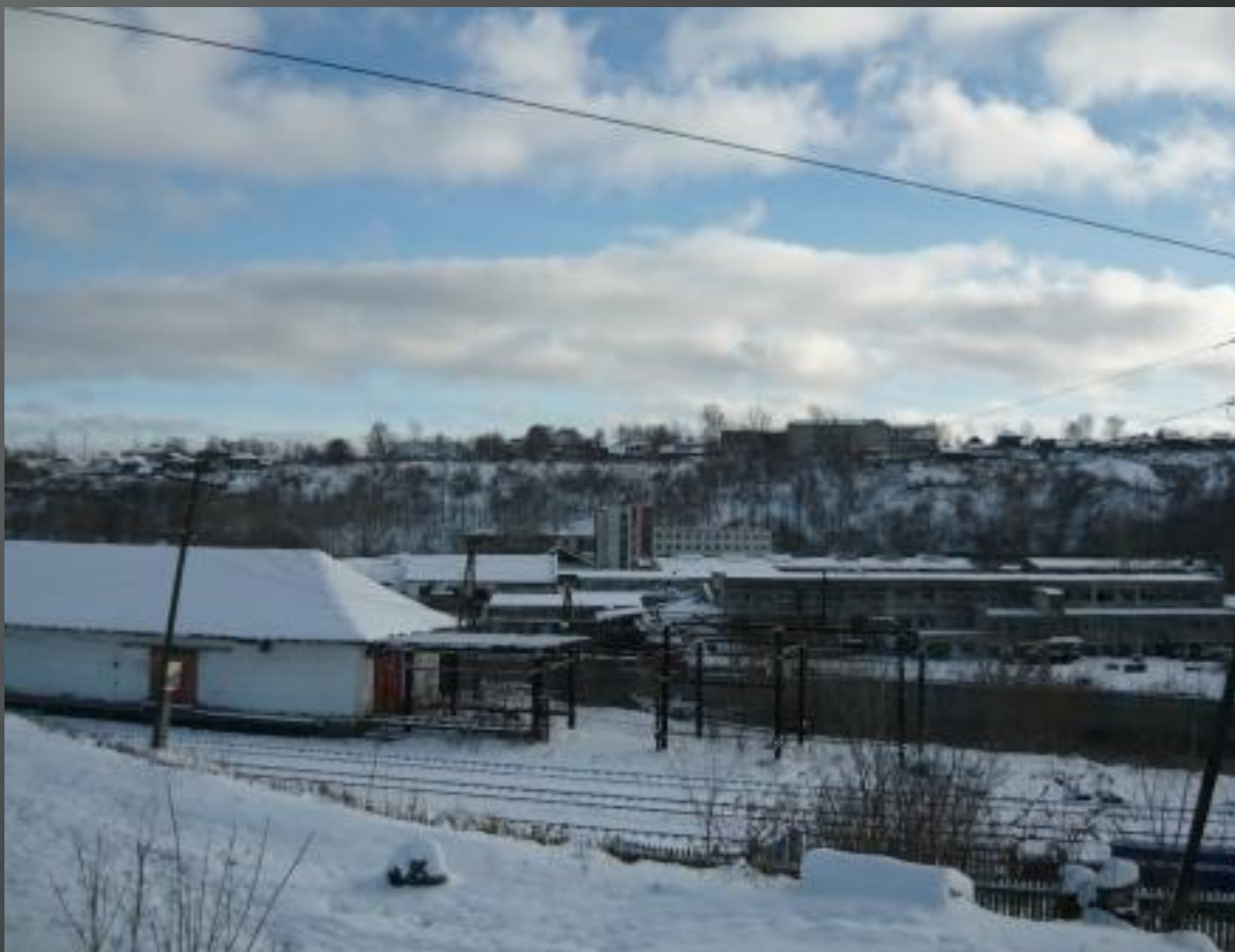
Юрюзанский механический завод им. С.М. Кирова