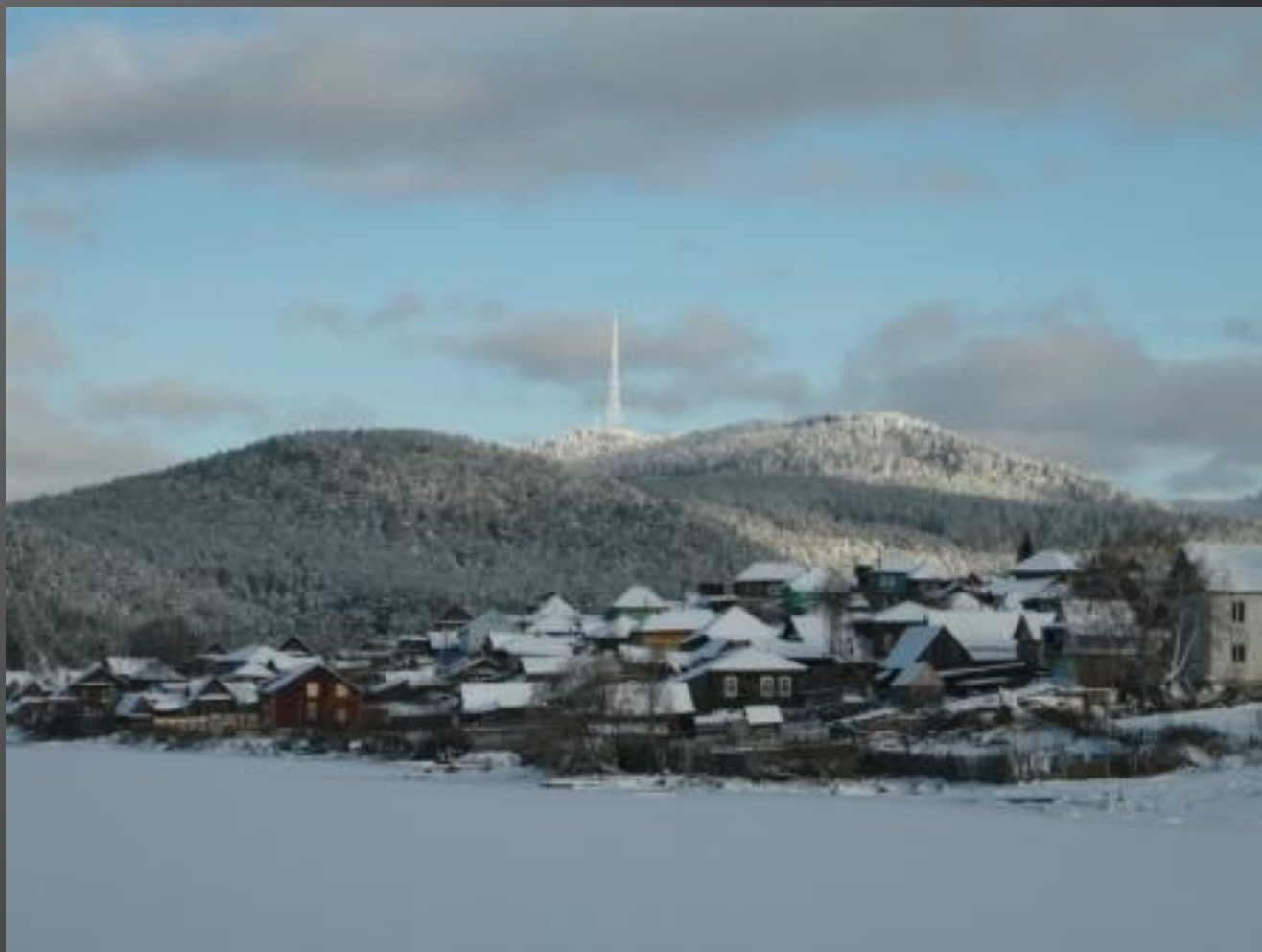
Курмыш, гора Шуйда