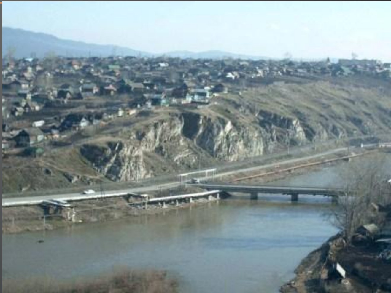
Река Юрюзань, лукинский мост