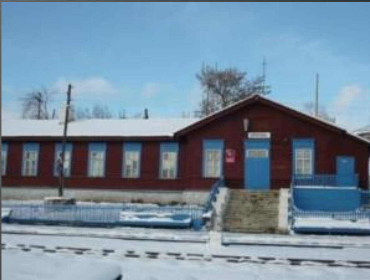
Железнодорожный вокзал г.Юрюзань