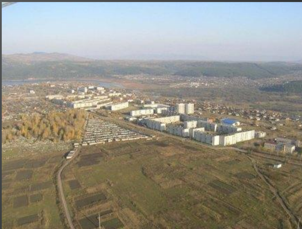
Вид города сверху (район Финских домов, Медгородок)

Юрюзань расположена в 236 км от областного центра г.Челябинск, в 19 км к северо-востоку от районного центра г.Катав-Ивановска