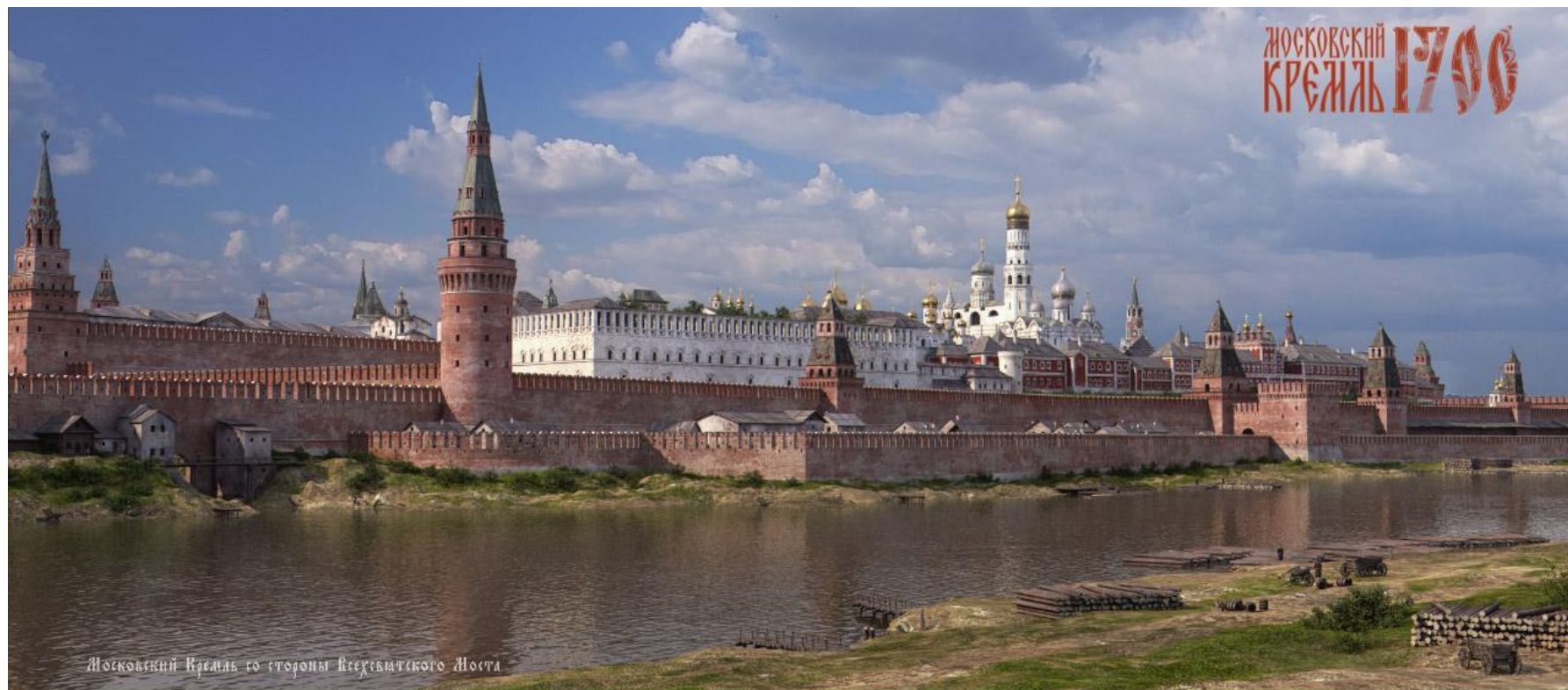
Московский Кремль со стороны Всехрамьенского Моста