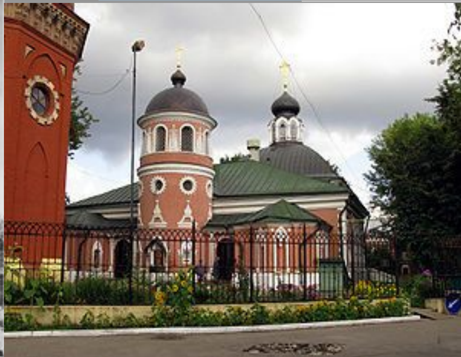
Храм свт. Николая Чудотворца на Преображенском кладбище.