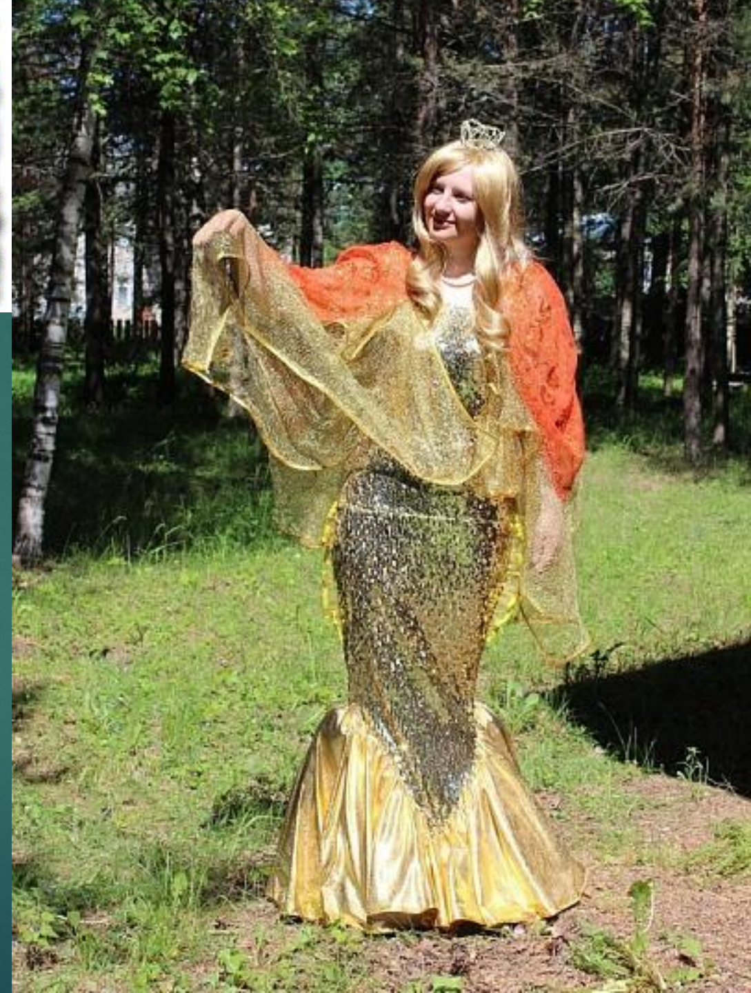
Терем Золотой Рыбки.