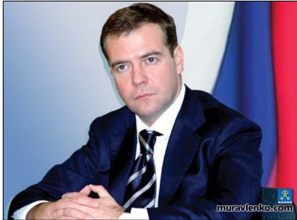
Дмитрий Анатольевич Медведев