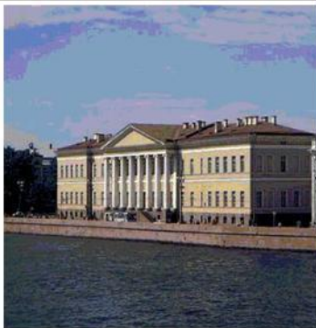
Здание Академии наук в Петербурге