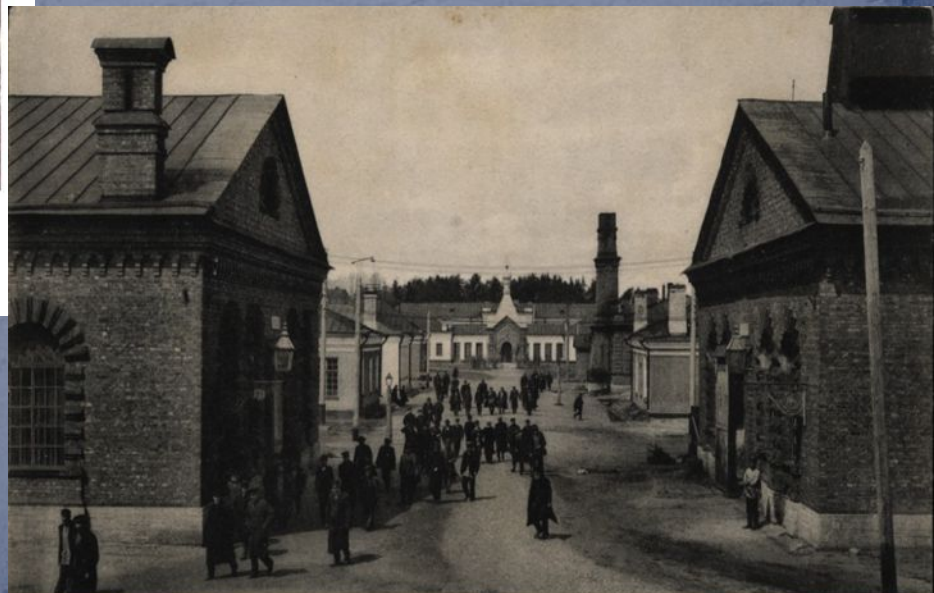
230. Сестрор. Оружейный завод — Внутр. дворь.