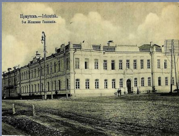
Иркутск.—Irkoutsk. 2-я Женская Гимназия.