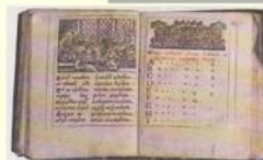
Одна из 1-х азбук, выпущенная при Петре I