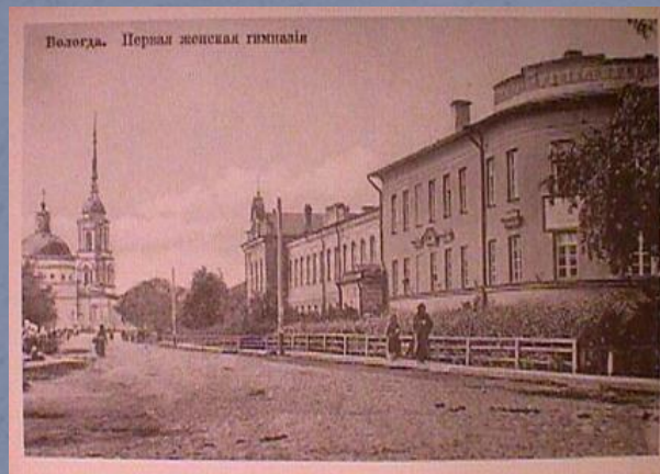
Волзга. Первая женская гимназия