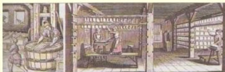
Первые заводы бумажного производства