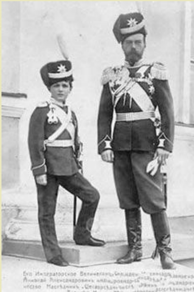
Его Императорское Величество Александръ II, Императоръ Россіи Александровичъ и Его Императорское Высочайшее Величество Цесаревичъ Александръ III, Цесаревичъ