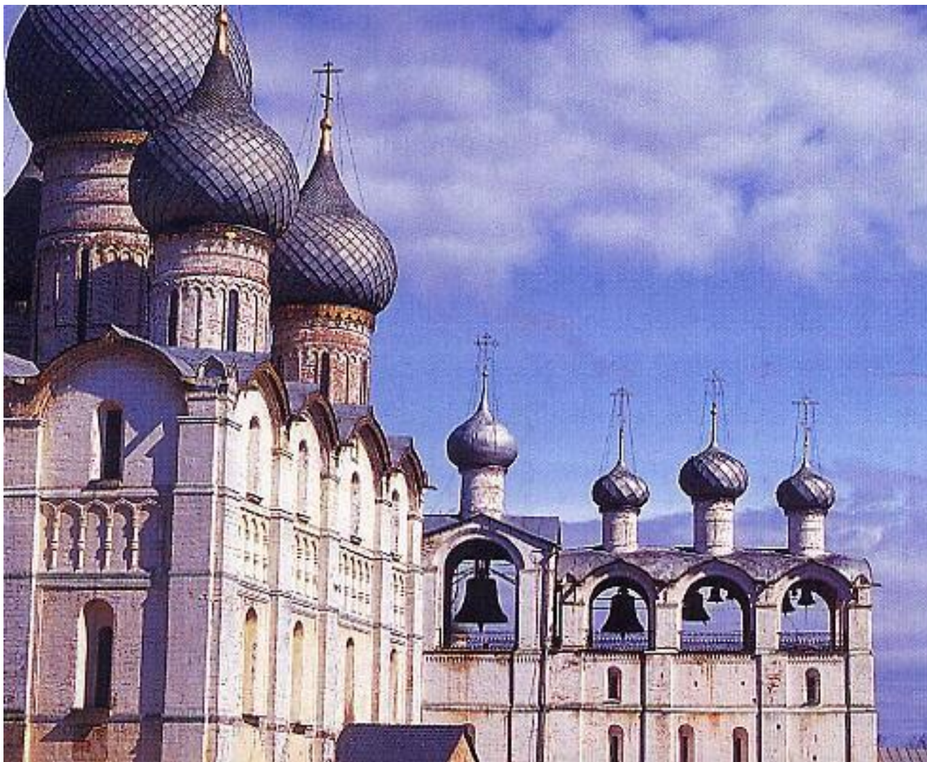
Это знаменитый пятиглавый Успенский собор.