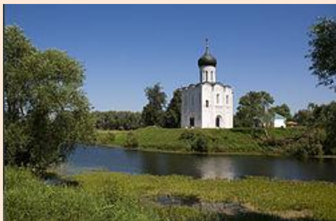
Церковь Покрова на Нерли

Первым европейскую каменную технику в Залесье начал использовать Юрий Долгорукий . При нём были возведены белокаменные постройки во Владимире , Суздале , Юрьеве-Польском , Переславле . До нашего времени дошли две из них — церковь Бориса и Глеба в Кидекше и Спасский собор в Переславле-Залесском. Оба храма датируются 1152 годом .