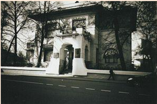
Особняк С. П. Рябушинского на Малой Никитской

В начале XX века в архитектуре отражаются тенденции господствовавших в это время архитектурных течений. Помимо русского стиля появляются модерн , неоклассицизм , эkleктика и др. Стиль модерн проникает в Россию из Запада и быстро находит своих сторонников.