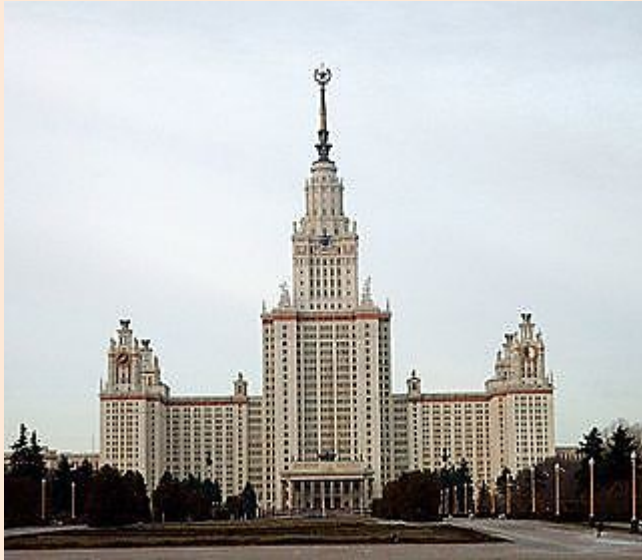
Главное здание МГУ