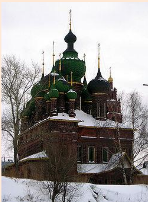
Церковь Иоанна Предтечи в Ярославле (1687)

Начало XVII века в России ознаменовалось сложным смутным временем , что привело к временному упадку строительства. Монументальные здания прошлого века сменились небольшими, иногда даже «декоративными» постройками. Примером подобного строительства может служить церковь Рождества Богородицы в Путинках , выполненная в характерном для того периода стиле русского узорочья . После завершения строительства храма, в 1653 году , Патриарх Никон прекратил строительство каменных шатровых храмов на Руси, что сделало церковь одной из последних выстроенных с применением шатра.