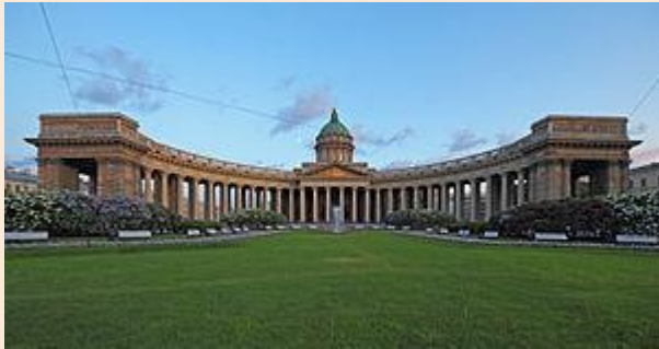
Казанский собор в Санкт-Петербурге

В 1760-х годах на смену барокко в русской архитектуре постепенно приходит классицизм . Яркими центрами русского классицизма стали Санкт-Петербург и Москва. В Петербурге классицизм сложился как завершённый вариант стиля в 1780-х годах, его мастерами были Иван Егорович Старов и Джакомо Кваренги . Таврический дворец работы Старова является одним из наиболее типичных классицистических зданий Петербурга.