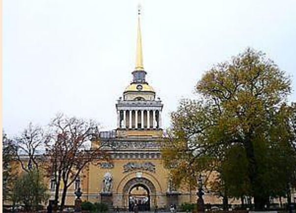
Здание Адмиралтейства в Санкт-Петербурге