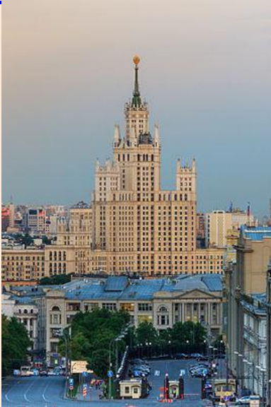
Жилой дом на Котельнической набережной

Стиль сталинской архитектуры сформировался в период проведения конкурсов на проекты Дворца Советов и павильоны СССР на Всемирных выставках 1937 года в Париже и 1939 года в Нью-Йорке . После отказа от конструктивизма и рационализма было решено перейти к тоталитарной эстетике , характеризующейся приверженностью монументальным формам, часто граничащим с гигантоманией, жёсткой стандартизацией форм и техник художественного представления. В 1934 году создаётся Академия архитектуры СССР и Союз архитекторов СССР , который объединял творческие силы для решения новых задач, поставленных перед мастерами и с помощью которых осуществлялся контроль над деятельностью архитекторов. Среди советских архитекторов данного направления можно выделить Бориса Михайловича Иофана , Дмитрия Николаевича Чечулина , Льва Владимировича Руднева и др. В целом, в сталинской архитектуре прослеживается связь с античными , ренессансными и барочными тенденциями.