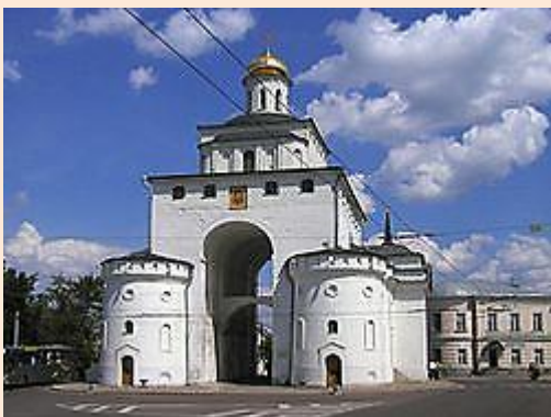
Золотые ворота во Владимире