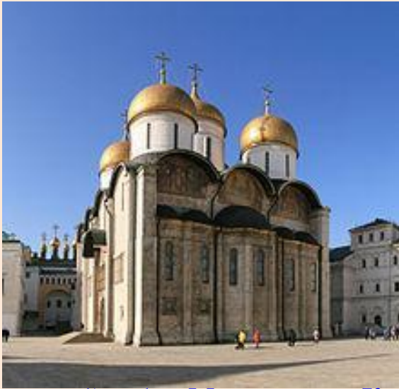
Успенский собор Московского Кремля