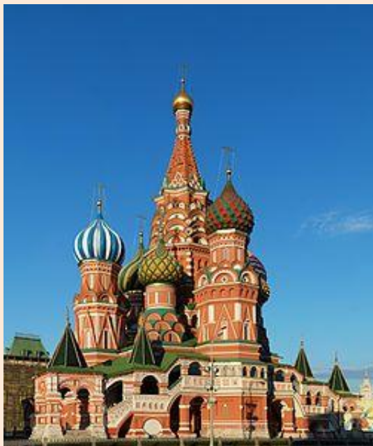
Храм Василия Блаженного

Принятие Иваном Грозным титула «царя» и превращение России в царство было очередным этапом развития русского государства и русской архитектуры в том числе. В архитектуре данного периода продолжают прошлые традиции, при этом в каменную архитектуру из деревянной проникает форма « шатра », что является заметным отличием в архитектуре нового периода. Самым известным памятником архитектуры данного периода является Храм Василия Блаженного , строительство которого продолжалось в 1554—1560 годах. Собор входит в Список объектов Всемирного наследия ЮНЕСКО в России . Храм Василия Блаженного, или Покровский Собор, был построен по приказу Ивана Грозного в память о взятии Казани, автором проекта, по одной из версий, стал псковский зодчий Постник Яковлев . Памятник является одним из самых узнаваемых символов Москвы и России.