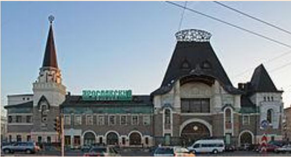
Ярославский вокзал (1902)