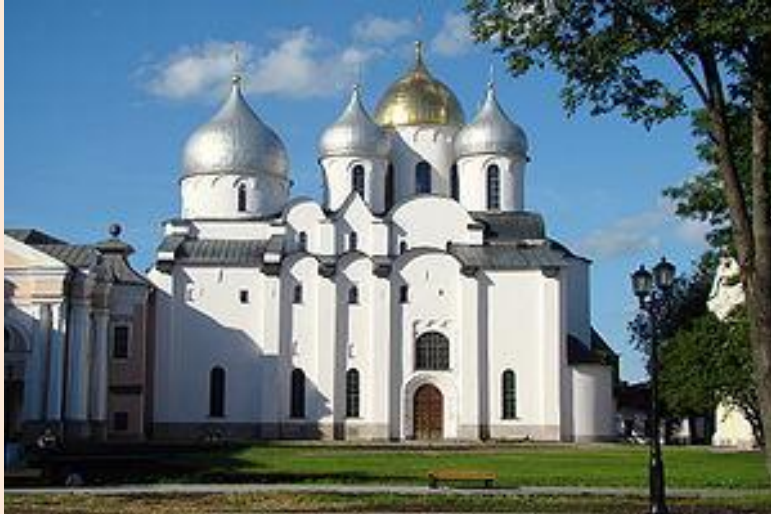
Софийский собор в Новгороде

Формирование новгородской архитектурной школы относят к середине XI века, времени строительства Софийского собора в Новгороде . Уже в данном памятнике заметны отличительные черты новгородской архитектуры — монументальность, простота, отсутствие излишней декоративности.