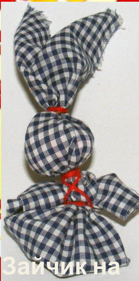
Зайчик на пальчик