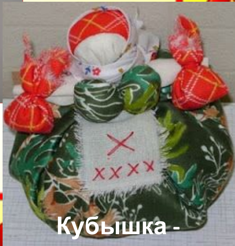
Кубышка - Травница