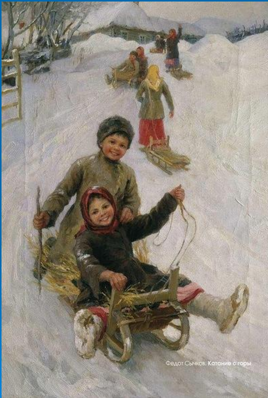
Федот Сычков. Катание с горы