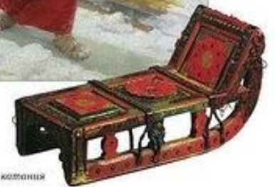
Сани для катания