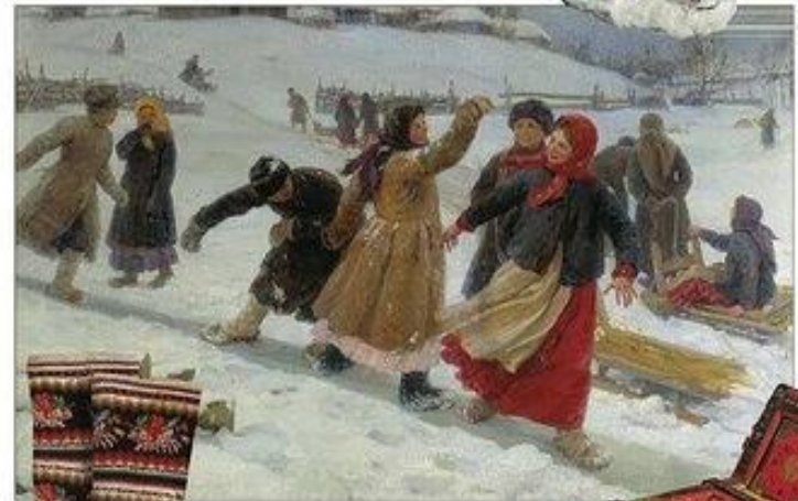
Федот Сычков. С горы