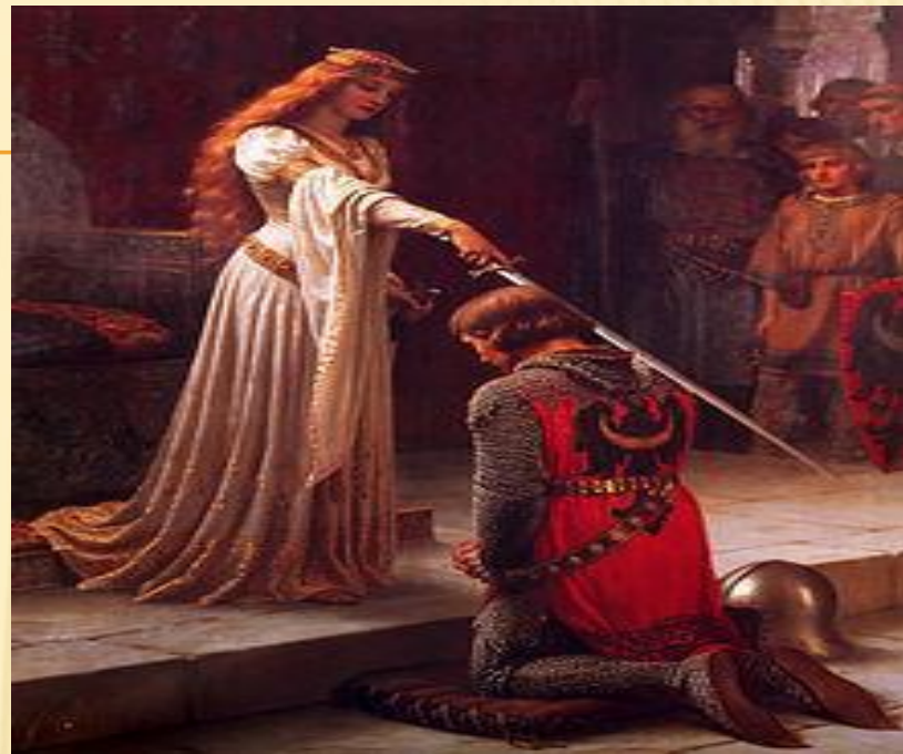
Посвящение в рыцари.