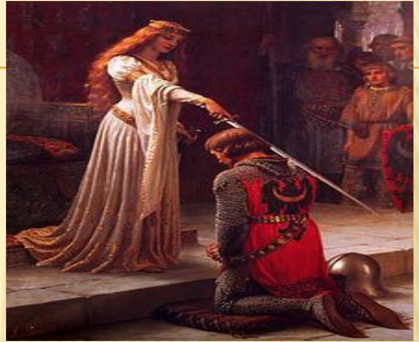
Посвящение в рыцари.