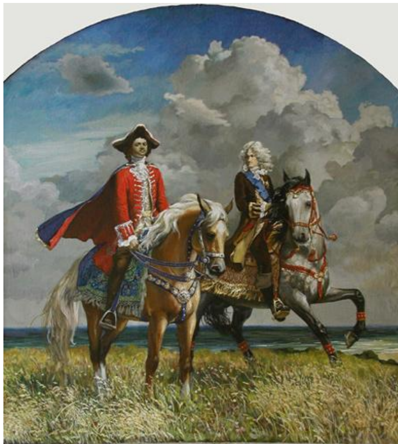
Панцырев Юрий, Петр I и А.Д.Меньшиков