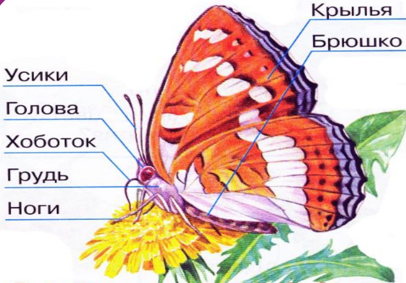
Внешнее строение бабочки