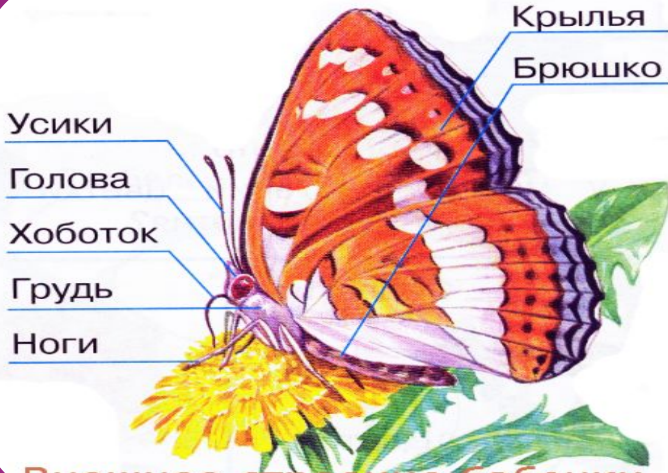
Внешнее строение бабочки