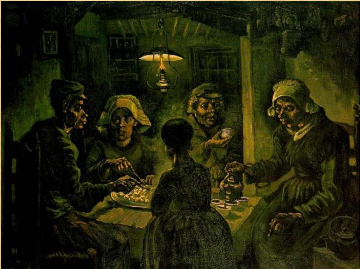
Едоки картофеля. 1885 г. Ван Гог