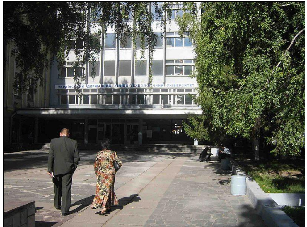
Головний вхід Дніпропетровського хіміко-технологічного інституту