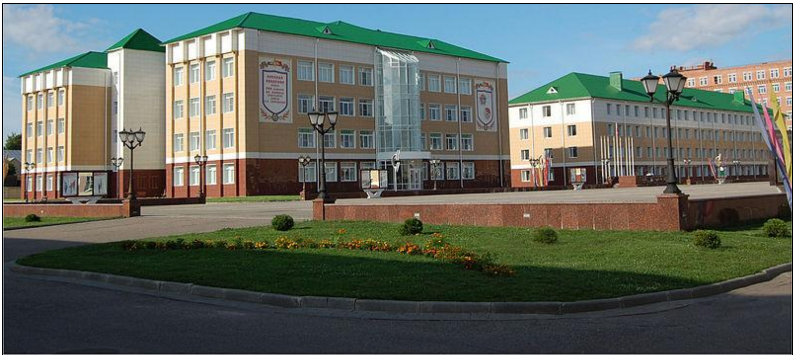
Військова академія хімічного захисту (м. Кострома, Росія)