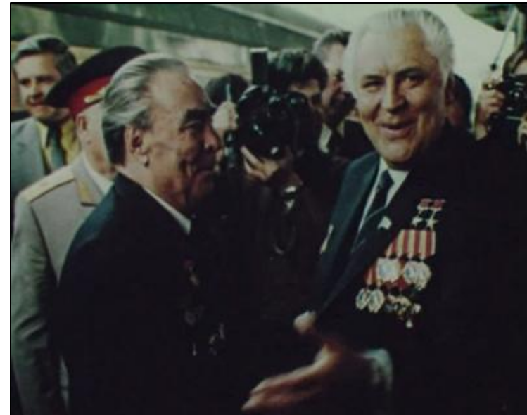
В. Щербицький та Л.Брежнєв