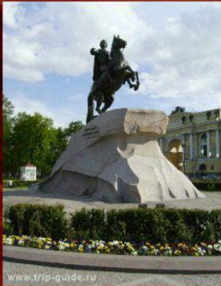
Памятник основателю города Петру 1 « Медный всадник »